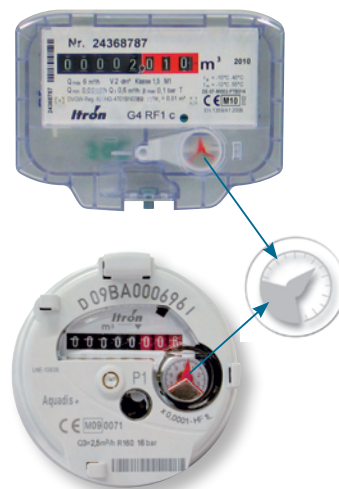
Itron Wasserzähler Zählwerk mit Cyble Target