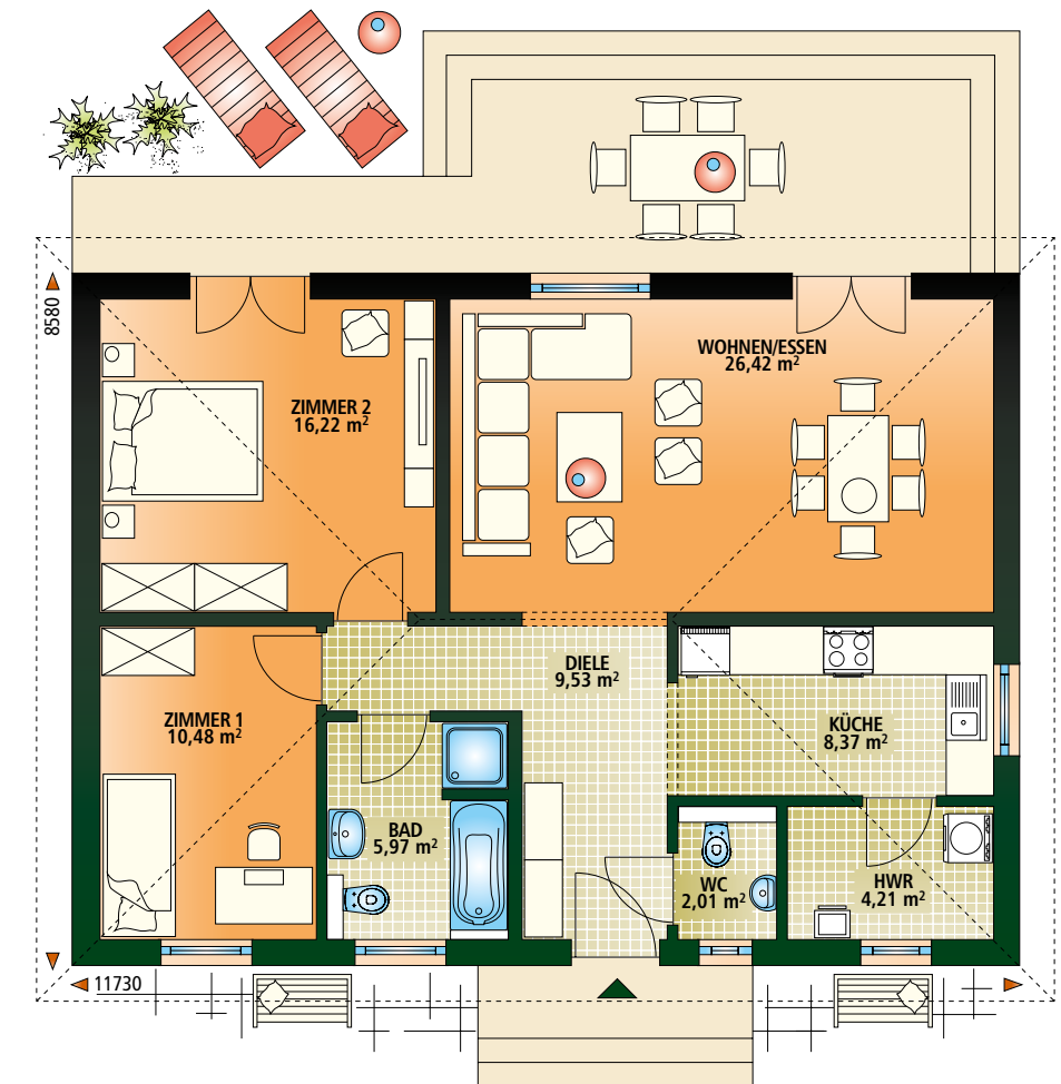
Erdgeschoss 83,21 m 2